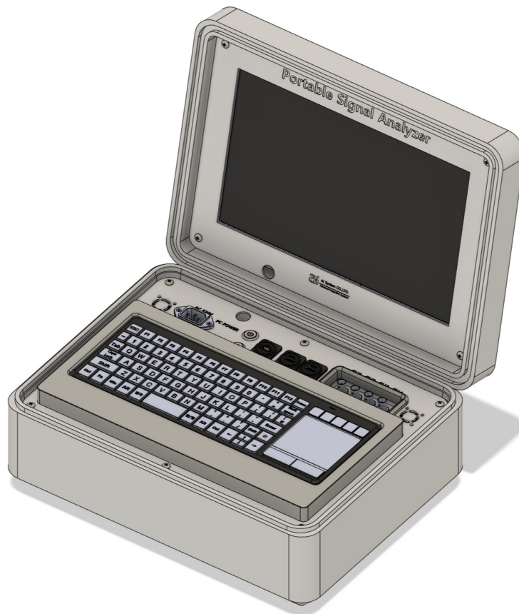
[ 포터블 측정기 모습 ]

제품의 외관은 아래 이미지와 같으며, 가방형태를 띄고 있습니다. 가방을 열면 상부에는 모니터가 위치하고 있으며 하부에는 DAQ하드웨어와 컴퓨터가 자리하고 있습니다. 사용자가 임의로 분해를 하였을 경우에는 A/S에 문제가 있을 수 있습니다. 문제 발생시에는 에이아이시스템즈(주)로 문의 주시기 바랍니다.